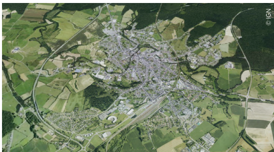
Vue 2D du village de l'Aisne.