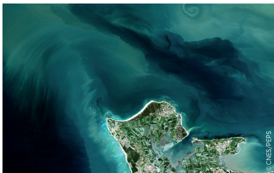
Estuaire de la Garonne.