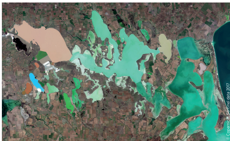
Le Syvach, Crimée, image Sentinel 2B- mars 2017.

PEPS a été créé par le CNES pour permettre l'accès à l'extraordinaire richesse d'informations, gratuites, systématiques et en temps réel, fournies par la famille de satellites Sentinel du programme Copernicus. L'accès aux données satellitaires est pour le CNES un moyen de soutenir l'usage des solutions spatiales.