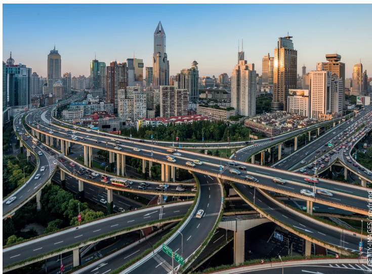
Infrastructures routières à Shanghai.

La mobilité est l'un des défis les plus urgents auxquels doivent faire face toutes les villes et leurs habitants. L'augmentation continue de la circulation automobile depuis des décennies génère des nuisances de toute sorte qui impactent la qualité de vie : congestion des infrastructures routières, perte de temps et d'argent, mauvaise qualité de l'air, émissions de gaz à effet de serre... À défaut de les éviter, les solutions issues des techniques spatiales permettent de limiter ces nuisances par une gestion dynamique des flux de circulation.