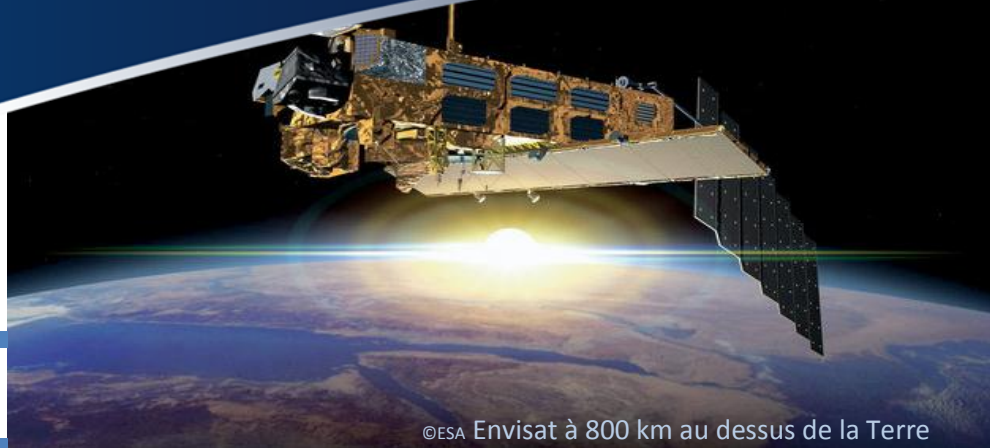
Envisat à 800 km au dessus de la Terre